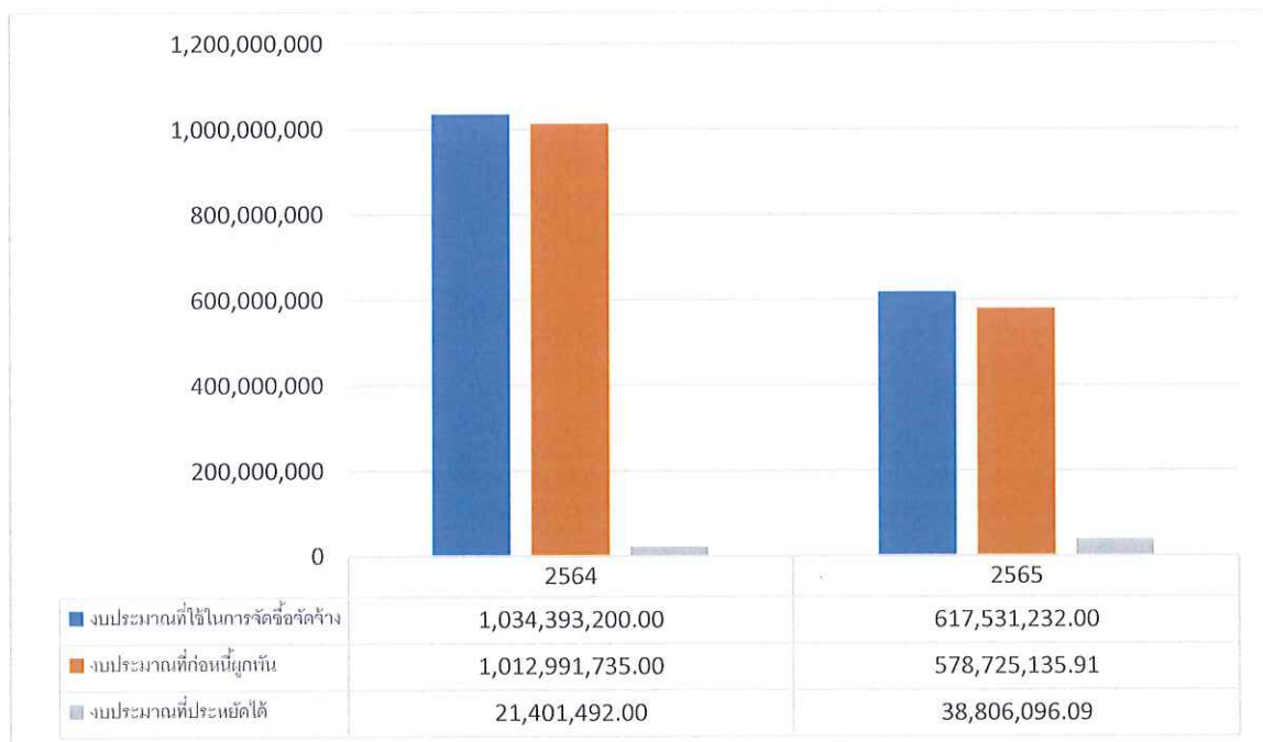
ภาพที่ 3 แสดงการเปรียบเทียบการจัดซื้อจัดจ้าง ระหว่างปีงบประมาณ พ.ศ. 2564 – 2565

ในปีงบประมาณ พ.ศ.2565 มหาวิทยาลัยมหาสารคาม ดำเนินการจัดซื้อจัดจ้าง จำนวน 14,185 โครงการ (ต่ำกว่าปี 2564 จำนวน 9,371 โครงการ) งบประมาณที่ใช้ในการจัดซื้อจัดจ้าง ทั้งสิ้นเป็นเงิน 617,531,232.- บาท (หกร้อยสิบล้านเจ็ดหมื่นห้าแสนสามหมื่นหนึ่งพันสองร้อยสามสิบลบาทถ้วน) ต่ำกว่า งบประมาณปี พ.ศ.2564 เป็นจำนวนเงิน 416,861,968.- บาท (สี่ร้อยสิบล้านแปดแสนหกหมื่นหนึ่งพันเก้าร้อยหกสิบลบาทถ้วน) โดยงบประมาณที่ประหยัดได้ เป็นเงิน 38,806,096.09 บาท (สูงกว่่าปีงบประมาณ พ.ศ. 2564 เป็นเงิน 17,404,604.09- บาท)